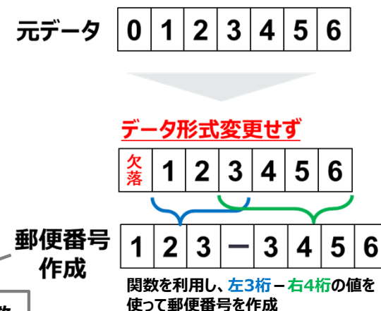
＜郵便番号の作成を誤った経緯＞

①「条件1」で特定のデータを抽出(フィルターを設定)したまま目視結果のデータの貼り付けを行ったため、データの行に相違が発生