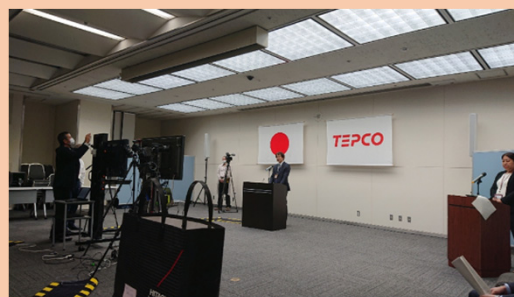
オンラインによる内定式