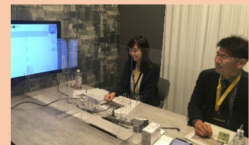
学生向けオンラインセミナーの開催