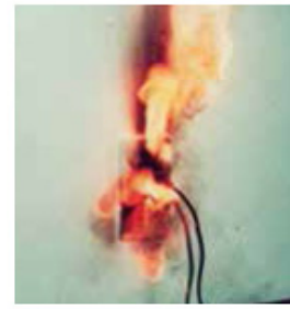
トラッキング現象による火災