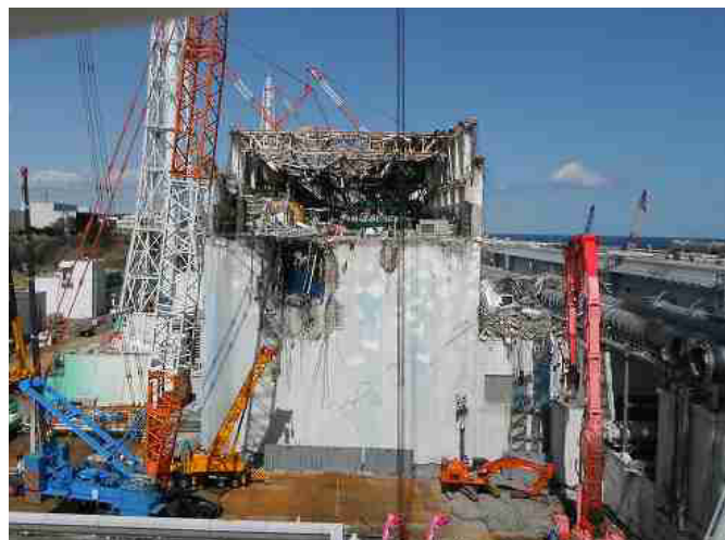
<全景（南面）> 撮影日：平成 24年 3月 20日