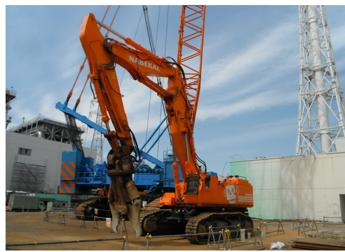
<破砕機 > 撮影日：平成 24年 4月 13日