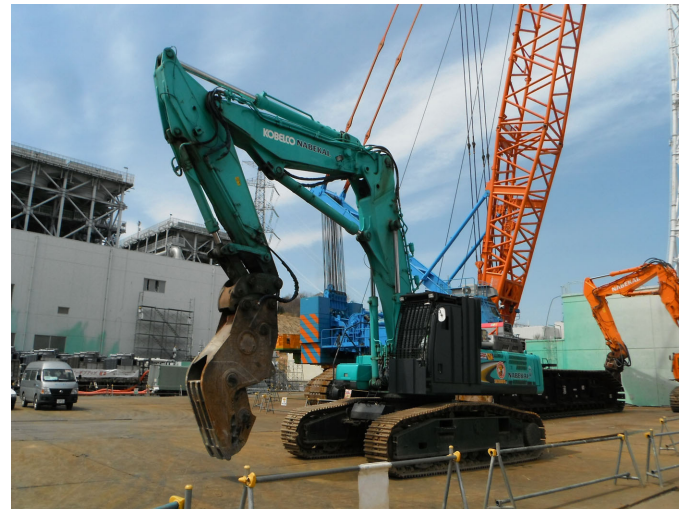
<破砕機 > 撮影日：平成 24年 4月 13日