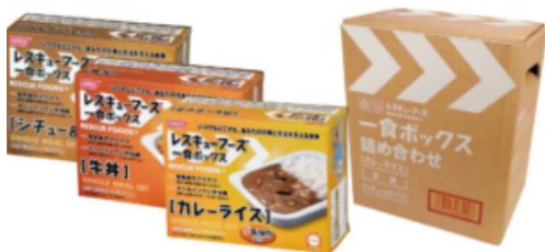
【レスキューフーズ】