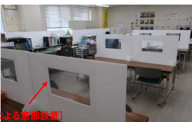
[透明プラスチック板による窓部設置]