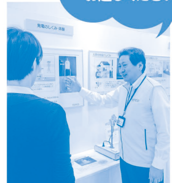
「東京電力コミュニケーションブース」開催風景