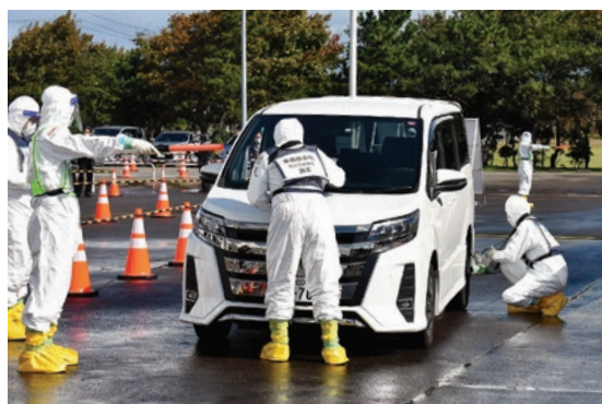
スクリーニングの様子