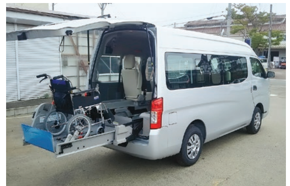
福祉車両（ストレッチャー車）