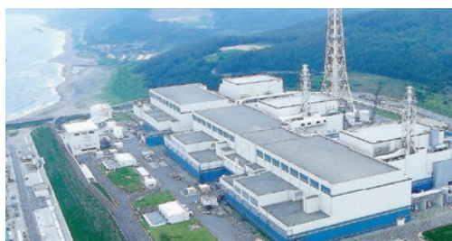
発電所の安全対策情報