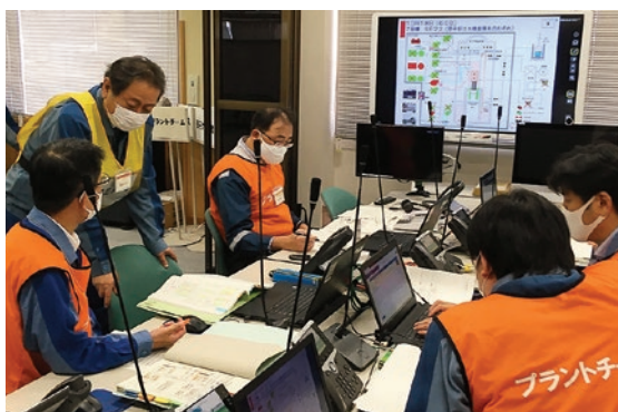
情報伝達訓練の様子

当社からは約140名の社員が参加し、災害対策本部や自治体等への情報伝達、スクリーニング、福祉車両を用いた要配慮者の搬送等の訓練を実施しました。今後、新潟県の訓練結果の検証に協力し、原子力防災の対応力向上に取り組んでいきます。