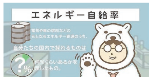
学べる映像・知りたい情報