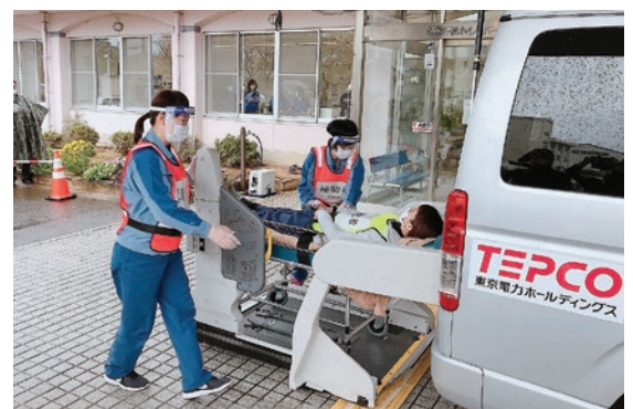
要配慮者の搬送訓練の様子