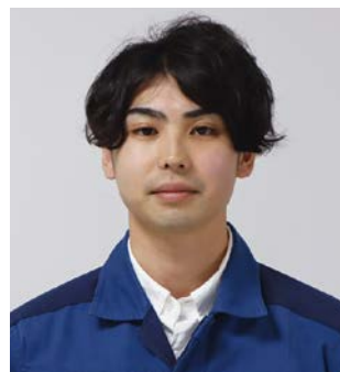
東京電力ホールディングス株式会社 柏崎刈羽原子力発電所 第二運転管理部 燃料グループ 兼 第一運転管理部 燃料グループ

長岡市出身。長岡市在住。2015年入社。柏崎刈羽原子力発電所に配属。新入社員研修を経て、2015年10月より現職に至る。休日の過ごし方：おいしいご飯を探しにドライブしています。今後の目標：【仕事】今回のように初めての業務や久しぶりの業務があるときは、細かいところまで確認しながら挑戦していきたいです。【プライベート】寒い日が続きますが、寒いから、忙しいからと言いつつ、健康維持と気持ちのいい仕事ができるよう、少しでも運動する機会を設けたいと思います。