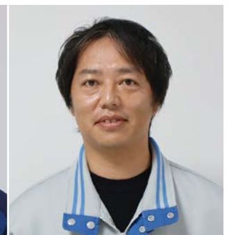
株式会社アトックス 柏崎刈羽事業所 保守工事課