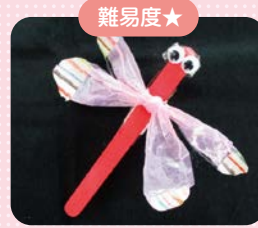
難易度★ カラフルとんぼクリップ

毎月違った3種類の工作をご用意♪ 難易度に合わせて、小さなお子さまでも 楽しくチャレンジできます。