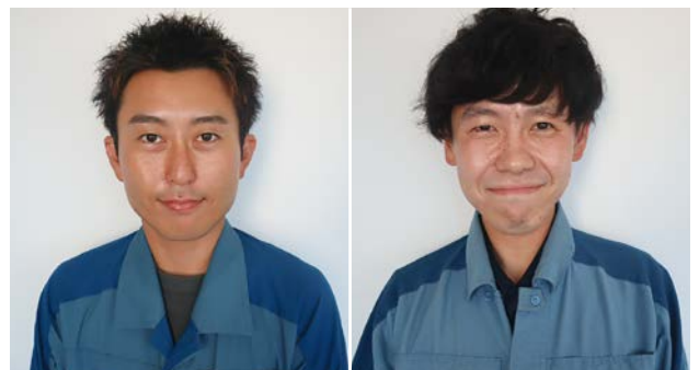
東京電力ホールディングス株式会社 柏崎刈羽原子力発電所 第二保全部 直営作業グループ