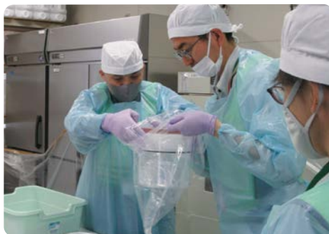
放射性物質濃度測定の前処理作業