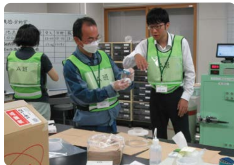
環境試料の放射性物質濃度の測定