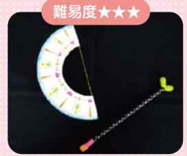
難易度★★★ 紙皿アーチェリー