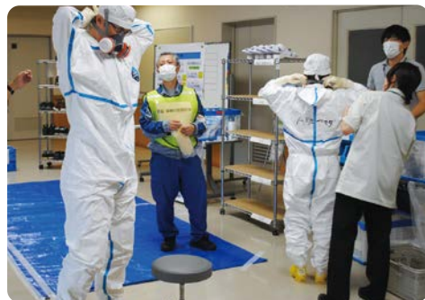
防護服の着用補助作業

引き続き、本訓練への参加などを通じて、原子力災害時の対応力向上に努めてまいります。