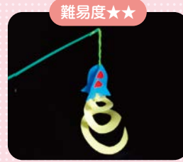
難易度★★ くるくるロケット