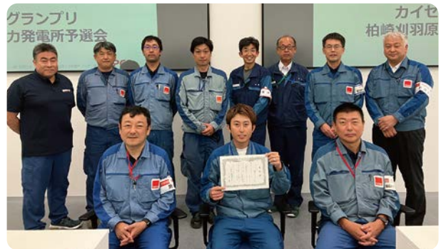
カイゼン活動の社内表彰の様子

効率の良い作業工法を構築できました。その活動の成果が認められた際にコツコツと実施してきたことが報われ、非常にうれしく感じました。