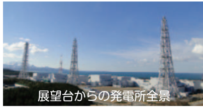
展望台からの発電所全景