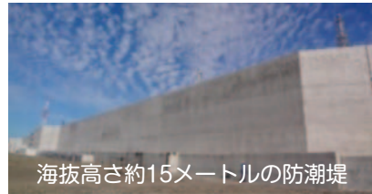
海拔高さ約15メートルの防潮堤