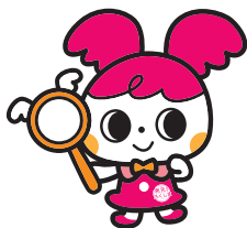
「発見!ふくしま」公式キャラクター "めっけちゃん"

なめらかな食感とすっきりとした味付です。常磐沖のあんこうのすり身を使用しています。