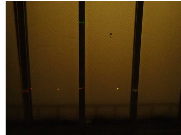
現在（2/26 午後1時頃撮影）