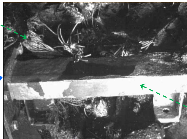
X-6パネル（高圧水による堆積物除去後①）