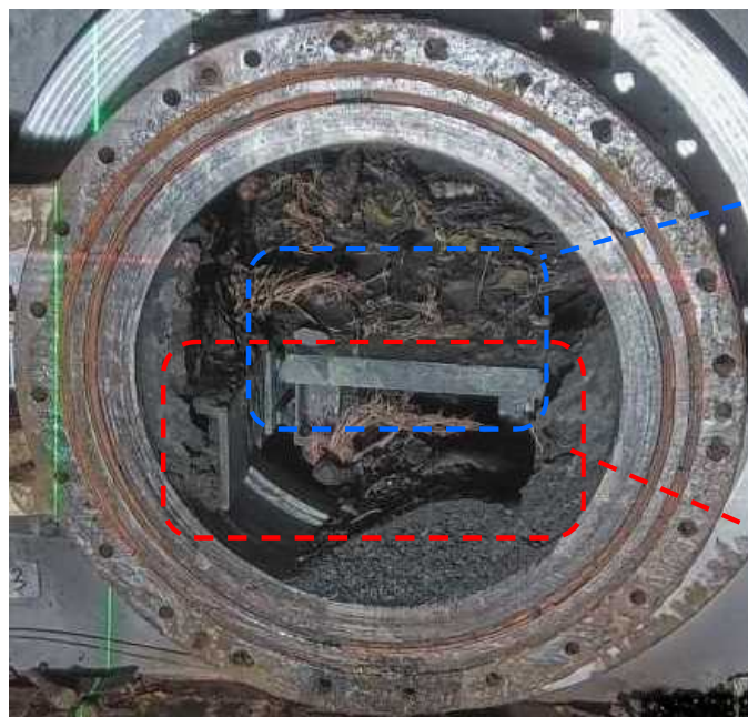
X-6パネル外観（低圧水による堆積物除去後）

< 参考資料 > 2024年2月26日 東京電力ホールディングス株式会社 福島第一廃炉推進カンパニー