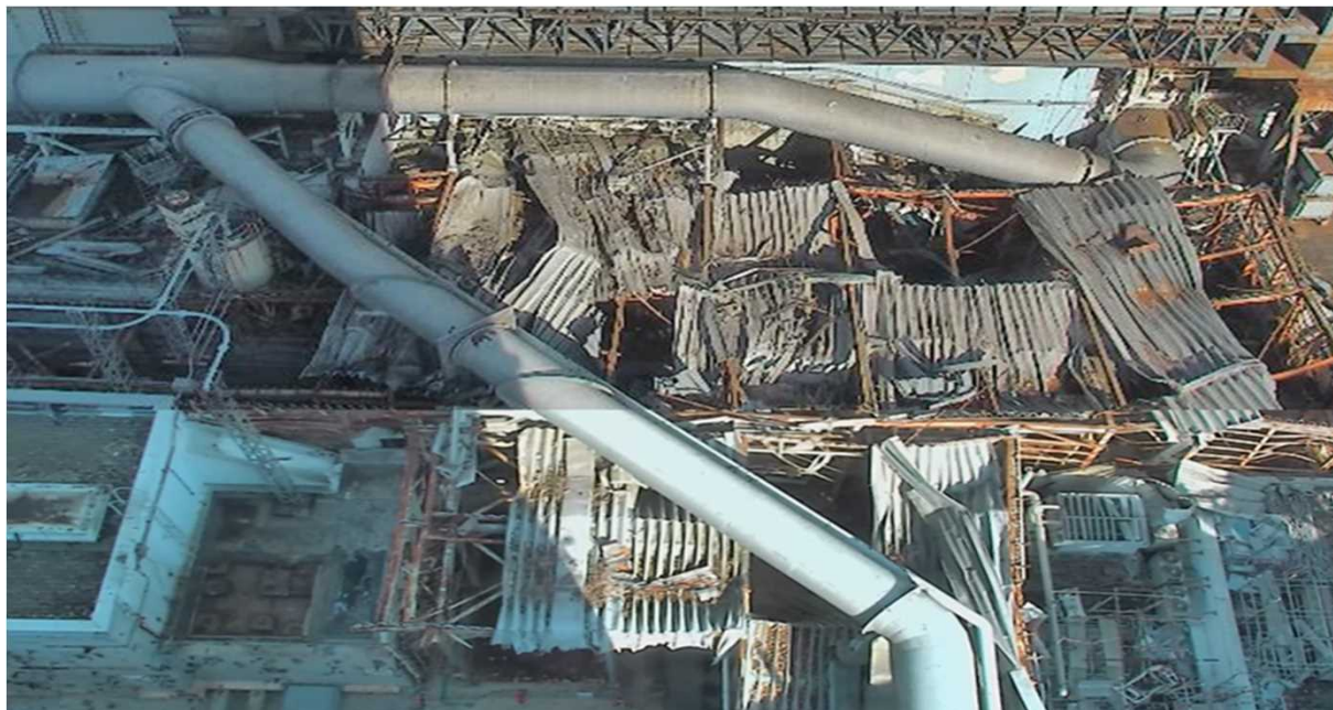
現在の状況 (2023年7月14日撮影)