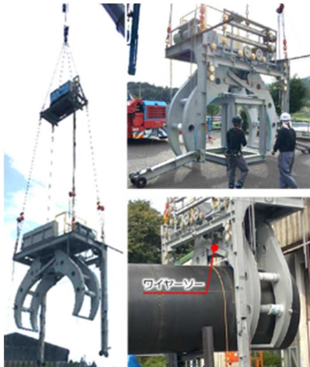
主排気ダクト切断装置