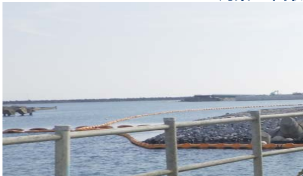
(既設) 重油オイルフェンス展張状況