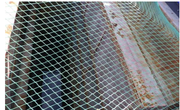
(既設) スクリーンメッシュ状況 (例: 5号機) ※ネット下に金属メッシュあり