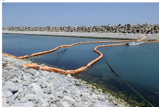
(既設) 5・6号機取水路開渠シルトフェンス展張状況