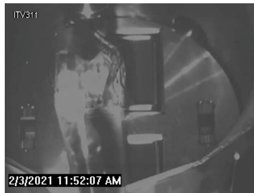
輸送容器への装填（⑨）