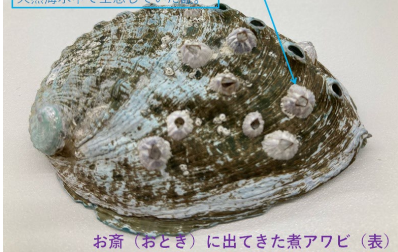
お斎（おとぎ）に出てきた煮アワビ（表）

私たちが飼育しているアワビと異なり、フジツボが殻に付着。天然海水中で生息していた証。