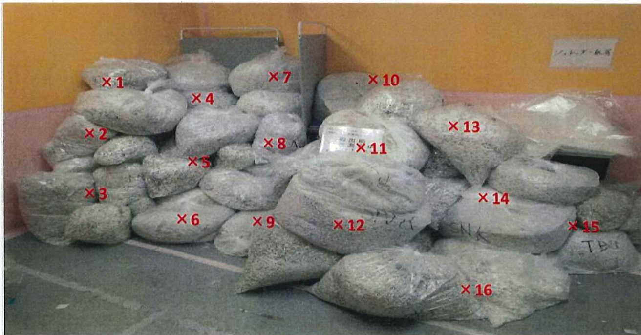
シュレッダー屑 表面線量率測定結果 ( \mu\text{Sv/h} )

測定器: F1-SC-136 時定数: 10 sec BG: 0.07 \mu\text{Sv/h}