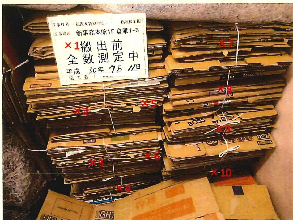
段ボール 表面線量率測定結果 ( \mu\text{Sv/h} )

測定器: F1-SC-137 時定数: 10 sec B G : 0.07 \mu\text{Sv/h}