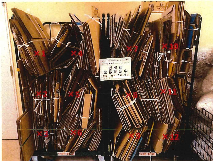
段ボール 表面線量率測定結果 ( \mu\text{Sv/h} )

測定器: F1-SC-137 測定数: 10 sec B G : 0.07 \mu\text{Sv/h}