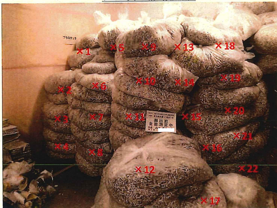
シュレッダー屑 表面線量率測定結果 ( \mu\text{Sv/h} )

測定器: F1-SC-137 時定数: 10 sec B G : 0.07 \mu\text{Sv/h}