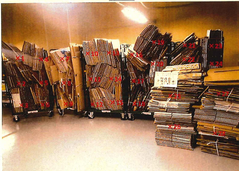
段ボール 表面線量率測定結果 ( \mu\text{Sv/h} )

測定器: F1-SC-137 測定数: 10 sec B G : 0.07 \mu\text{Sv/h}