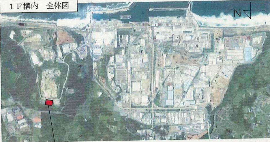
1 F 構内 全体図