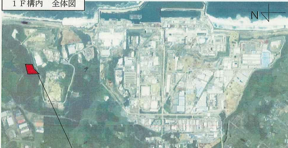
1 F 構内 全体図