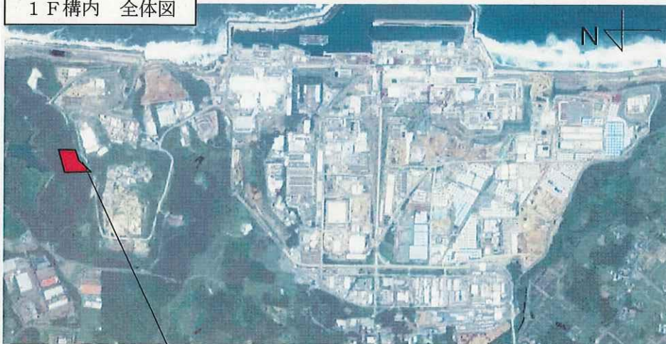
1 F 構内 全体図