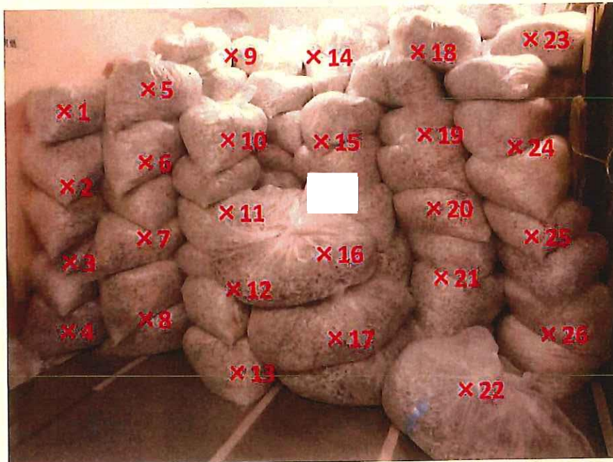
シュレッダー屑 表面線量率測定結果 ( \mu\text{Sv/h} )

測定器: F1-SC-209 時定数: 10 sec B G : 0.07 \mu\text{Sv/h}