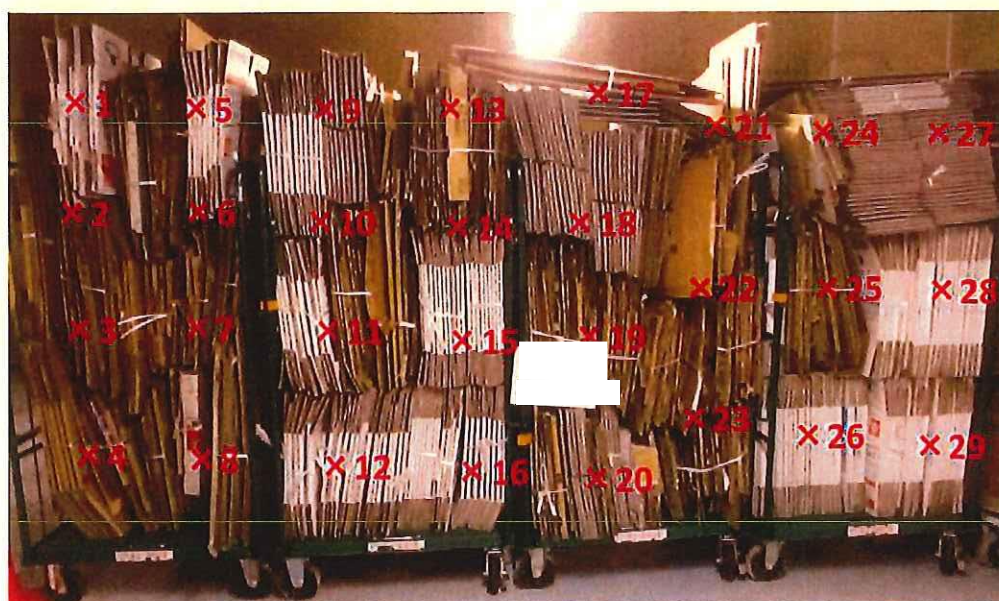
段ボール 表面線量率測定結果' ( \mu Sv/h)

測定器: F1-SC-209 時定数: 10 sec B G : 0.07 \mu Sv/h