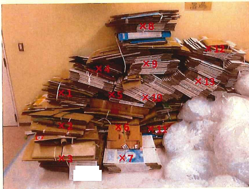
段ボール 表面線量率測定結果 ( \mu\text{Sv/h} )

測定器: F1-SC-209 時定数: 10 sec B G : 0.07 \mu\text{Sv/h}