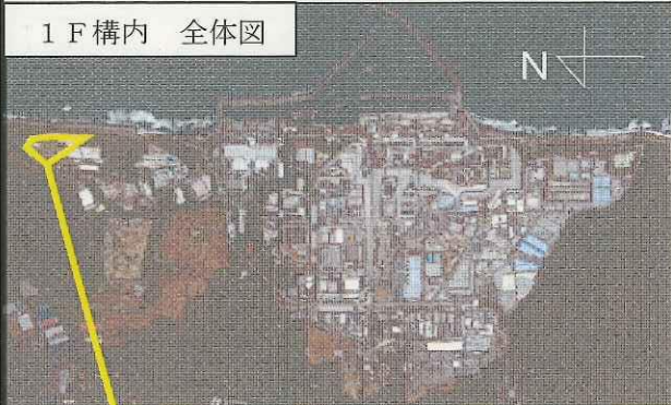
1 F 構内 全体図