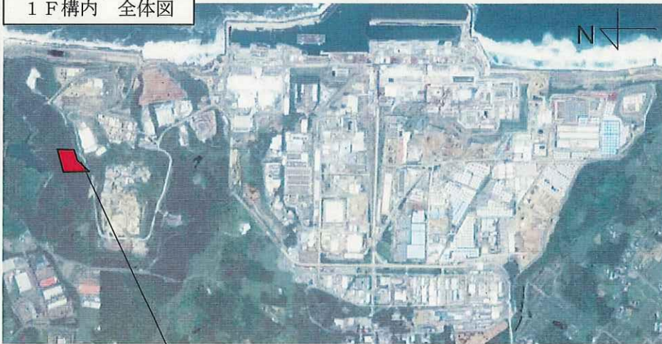
1 F 構内 全体図