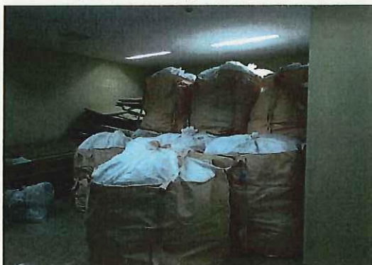
ペットボトル (袋入り)