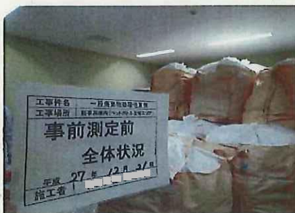
ペットボトル (袋入り)