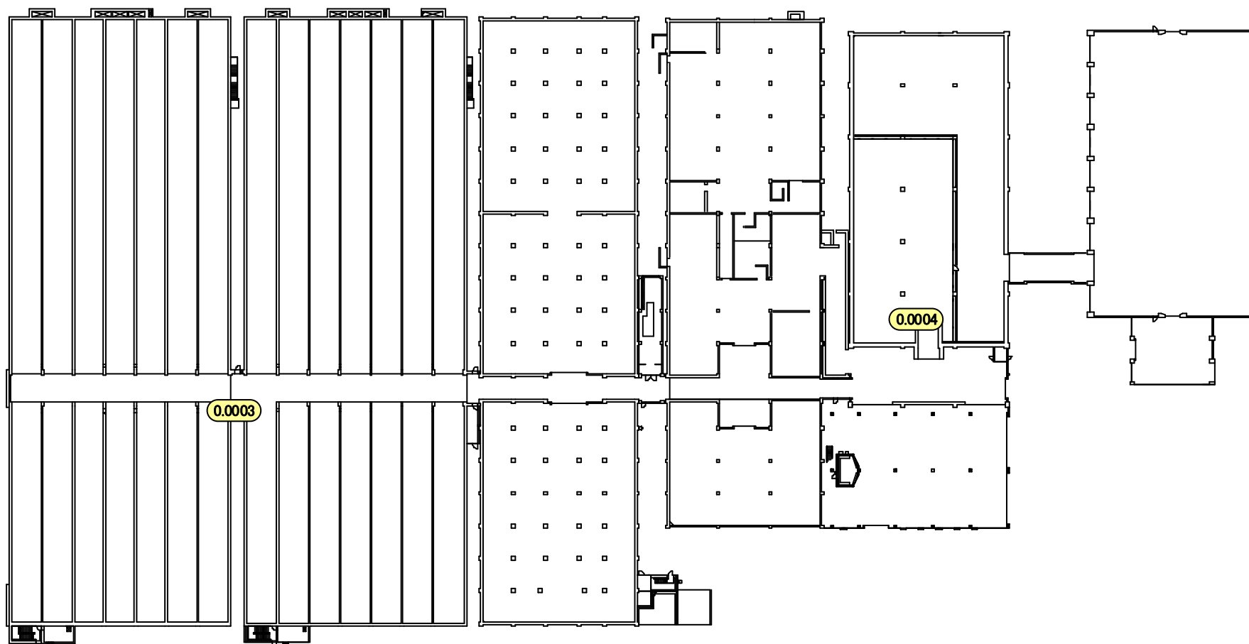
固体廃棄物貯蔵庫 第3棟