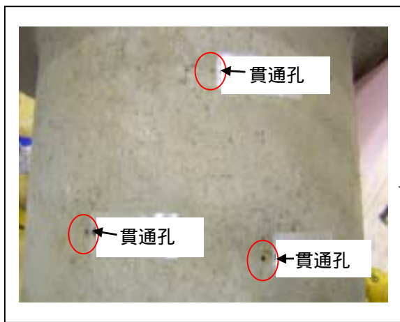
Aポンプバレル貫通孔