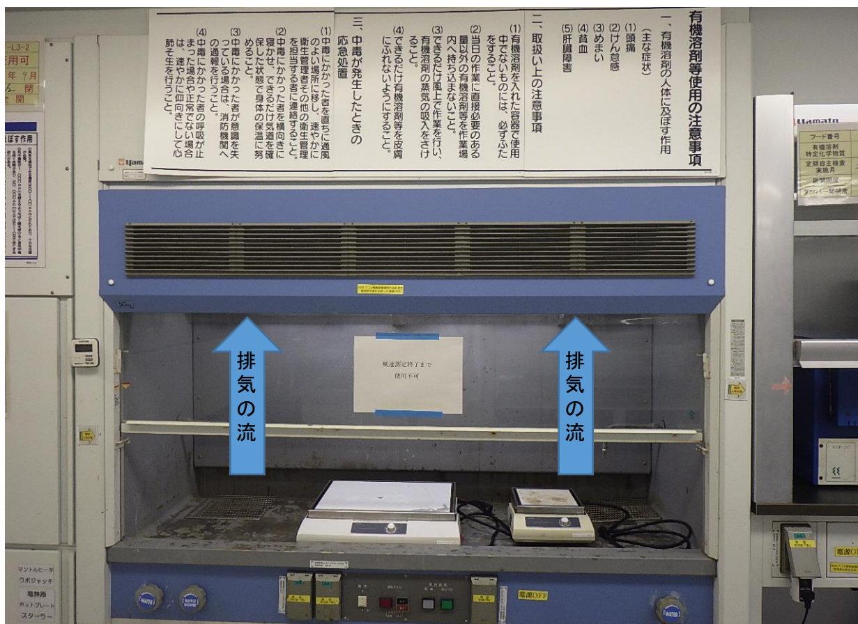
2022年10月25日に定期自主検査を終了した当該装置