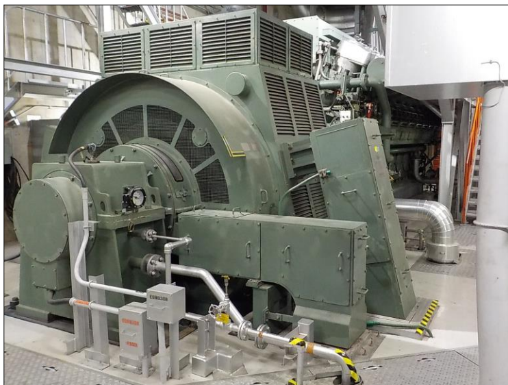
24時間運転確認を実施する3号炉非常用ディーゼル発電機 (B)